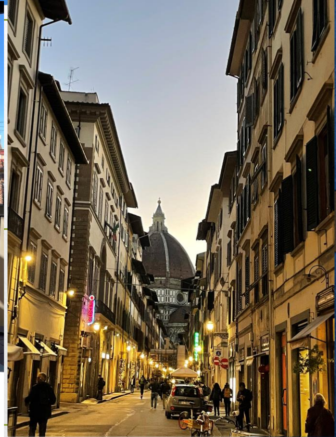
Università degli Studi di Firenze, Włochy.